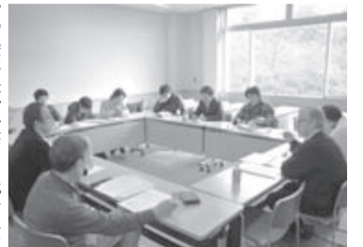
分科会では、テーマに沿った話の他、運営上の問題なども出され、他のキャンプ場が解決例を上げて解説する場面もあった。