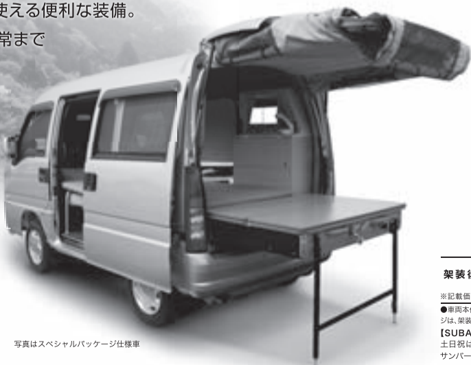
写真はスペシャルパッケージ仕様車