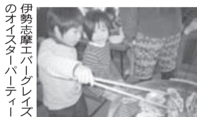
伊勢志摩エバークレイズ のオイスターパーティー

ず。冬用の装備があれば 多少の寒さもお正月のい い思い出になるのでは。 全国の主な年越しキャン プを行っているキャン プ場を紹介。