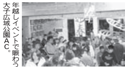
年越しイベントで賑わう 大子広域公園AC。

年末年始は隠れたキャンピングシーズン。 静かな夜をテントやキャンピングカーの中で過ごすのを楽しみにしている人も多い。 キャンプ場でも様々なイベントで年越しを盛り上げてくれるところも全国にある。 年越し蕎麦、餅つき、カルタ作り、地元伝統のお雑煮、牡蠣プレゼント、打ち上げ花火、抽選会、年が明けて元旦の初日の出、などキャンプ場や地元の特徴を活かしたたく