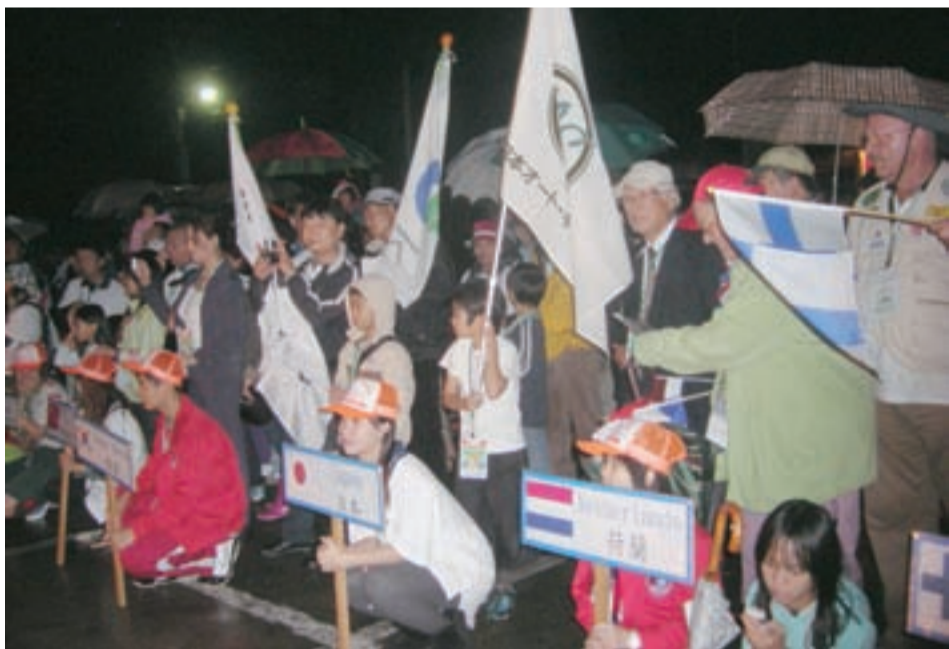
写真上は参加各国の旗が並ぶ開会式。左は小雨の降る中で入場行進の後、開会式会場に並ぶ参加者。右は小旅行で訪れた花博会場。