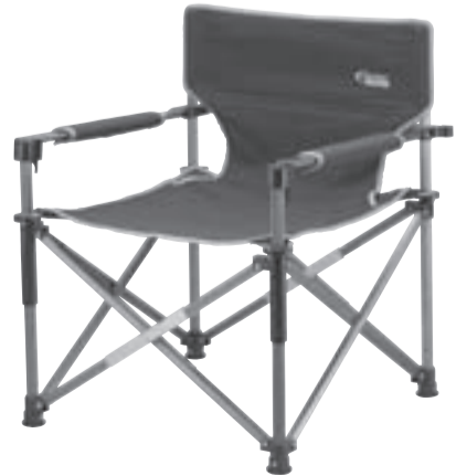
コンフォートマスター™ スリムキャンバスチェア 参考価格8,800円(税込)

コールマンのフラッグシップで、技術と素材の贅を尽くしたキャンピングギアの最高峰である「マスターシリーズ™」は、キャンプライフに一層の寛ぎを提供するため“コンフォート(心地良さ)”と“利便性”を素材の一つ一つから追求したコールマンの最上級ブランド。2011年そのシリーズに新たな5つの製品が加わります。 極上の座り心地と収納性を兼ね備えたチェアや、デザイン性に優れワンタッチで設営可能なキッチンテーブルなど、“大人のキャンプ”に一層の寛ぎをもたらしてくれる「コンフォートマスター™」シリーズで、極上の空間と時間を是非お楽しみ下さい。