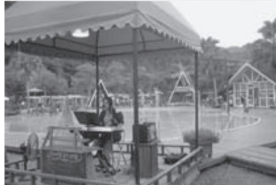
上・風船で飾られた大会会場受付 下・会場のプールサイドで行われたコンサート。