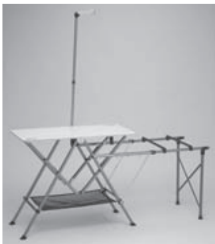
コンフォートマスター™ ワンタッチキッチンテーブル 参考価格16,380円(税込)

コールマンのフラッグシップで、技術と素材の贅を尽くしたキャンピングギアの最高峰である「マスターシリーズ™」は、キャンプライフに一層の寛ぎを提供するため“コンフォート(心地良さ)”と“利便性”を素材の一つ一つから追求したコールマンの最上級ブランド。2011年そのシリーズに新たな5つの製品が加わります。 極上の座り心地と収納性を兼ね備えたチェアや、デザイン性に優れワンタッチで設営可能なキッチンテーブルなど、“大人のキャンプ”に一層の寛ぎをもたらしてくれる「コンフォートマスター™」シリーズで、極上の空間と時間を是非お楽しみ下さい。