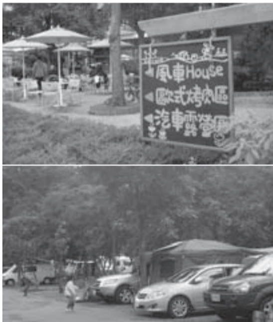
上・場内の案内表示。「汽車露営区」はキャンピングカーサイトをさす。下・日本のものと間違えそうな台湾のサイトの風景。