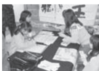
女の子に大人気? 竜王山 キャンプ場の書き初め。

さんイベントが毎年行 われている。 行く年を惜しみながら 空の色や風を感じ、焚き 火を囲んで過ごす時間 は、いつものキャンプと は一味違うものになるは