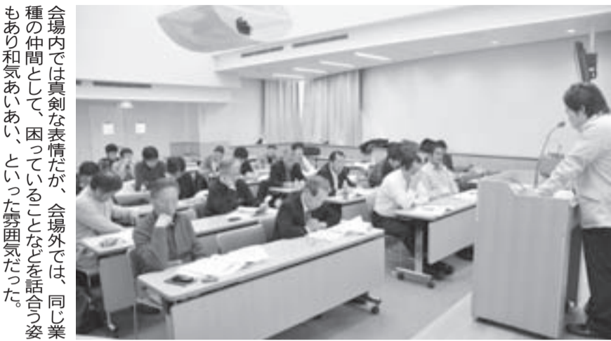
会場内では真剣な表情だが、会場外では、同じ業種の仲間として、困っていることなどを話合う姿もあり和気あいあい、といった雰囲気だった。