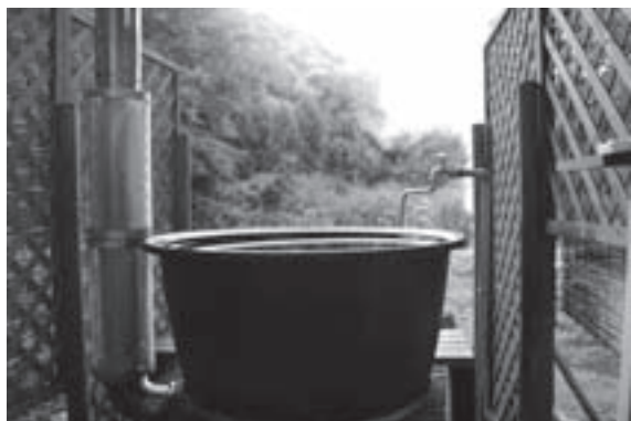
オートキャンプ場五右衛門 福島県耶麻郡猪苗代町蚕養大橋平 3435 090-6511-9986

2009年に発売されたのがコイズミの「かるキャン」。軽トラックの積載されたシェルは横にライドアウトするだけでなく、天井部も持ち上がり、広いリビングスペースを創る。同社は自動車部品の販売など自動車関連事業を行っており、新事業としてキャンピングカー事業を開始した。リビングスペースをつくりと形が変更することから「トランスフォームキャンパー」と名付けられている同車は、そのインパクトの強さから、様々なマスコミから注目されている。このモデルが今後どのように進化していくのか注目の1台であることは間違いない。