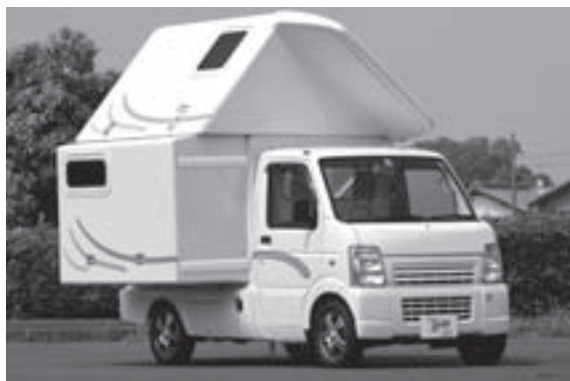
コイズミ 東京都板橋区熊野町 33-3 03-3955-1211