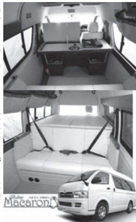
キッチンを中心を持つことで(写真上)後部の空間をより広く使うことができる。後部の広いスペースの下がペット部屋に(写真下)。

室内は中央にキッチン、キッチンがセンターシアターの正面にあるので、作業がしやすい。後部は一段高い場所にベッドスペースを備え、その下はベッドの部屋となるスペースになっている(写真上)。ペット用スペースは、室内との境を金網で仕切ることができ、ペットも飼い主の姿を確認でき、人もペット