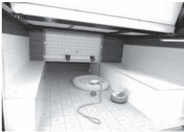
ペットルームは広い。奥の金網の向こうは室内。目隠しを外せば、室内とペット部屋が金網越しにつながる。

ペット連れの2人旅に特化したハイエースベースのキャンピングカー。「バルミー」は大森の老舗キャンピングカー販売店「大森自動車」のトヨタのハイエースをベースとしたキャンピングカーのシリーズで、「マカロン」は、後部にペット用ケージを備えたペット連れの2人旅を設定して開発されたモデル。