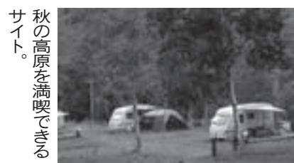
秋の高原を満喫できるサイト。

3回目の今回は、陶芸体験、そば打ち体験を実施。陶芸体験は25日の午後2時からで1人1300円。そば打ち体験は26日の午前10時からで1人1000円。