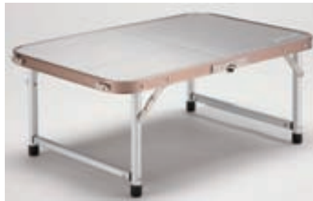
コールマンジャパン

焚き火の脇でちょっと小物を置きたい時の小型テーブル。丈夫なステンレス天板で、ダッチオープンも乗せられる堅牢さを持つ。60×40×25cmで収納サイズは40×5×30cmとコンパクトに。6615円。01200・111・9577。