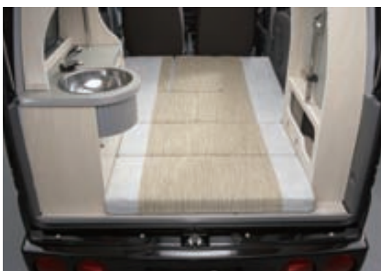
就寝定員の2人には余裕の広さ。ポップアップによりタテにも空間が広がる。

ラゲッジ床部のスライドデッキの中は収納スペースになっており、引き出せばテーブルやベッドに早変わり。リヤゲートテントを使えば、軽ワンボックスの中に、最大3.3m×1.2mの居住空間を作り出すことができる。ベイス車+24万6750円。0120-052215。