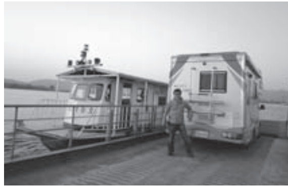
韓流キャンパーの聖地に向かう最終便のフェリーで。

この韓国式の食べ方はうまい。韓国に来る事があれば、ぜひこの食べ方をお勧めしたいと思う。刺身も半分なくなった。刺身と一緒にお茶を飲んだ。お茶を使ったチゲ(鍋)が運ばれてきた。アラの辛味鍋で、仕上げは乾麺である。これも絶品。