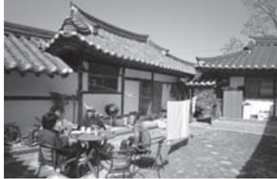
お茶に呼ばれた管理人の自宅。歴史と生活を身近に感じる。