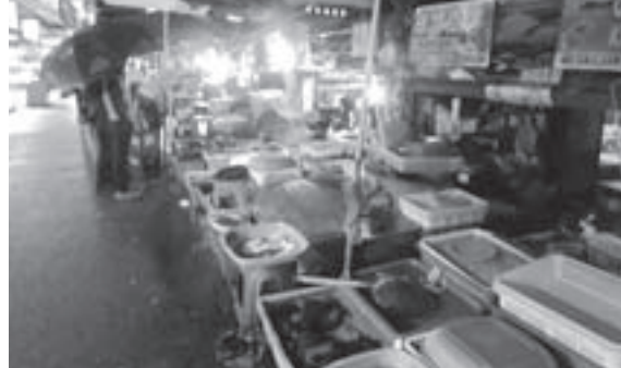
アジア気配たっぷりの市場の様子。その場で食べる新鮮な刺身はお勧めだ。