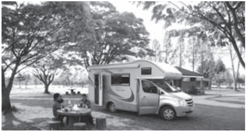
韓国プレミアムツアー //www.shcamping.co.kr/shop/shopbrand.html?xcode=056&type=0

今回の旅は、業務提携先である「SHキャンピング」のレンタカーを利用した韓国ツアーになった。これまで韓国には数回訪れたが、ソウル周辺の観光旅行だった。またまた立ち寄った本屋に、ペ・ヨンジュン氏の「国の美をたどる旅」を手にとると、今回の旅行に同行する説明好きの Jae 氏曰く「この本は日本のマスコミに韓国のことを尋ねられて、答えられなかったペ・ヨンジュンが、自ら韓国各地の伝統、文化、美を捜し、記録したもの。写真も自身で撮影したもので韓国でも大人気である。日本語訳の本も発売されている」