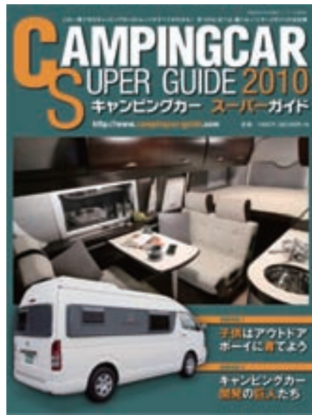
クルマの紹介だけでなく巻末に収録されているキャンピングカーの販売店を紹介したショップガイドも購入希望者には大切な情報だ。

「スタッフトック」では開発者のコンセプトやそのクルマに対する思い入れが、「レポート・チェック」では専門家から見たクルマの特長や細かな工夫などに触れる。本文では、作り手や専門家の目を通した情報を集約し、それぞれのクルマの特長や他のクルマとの違いをわかりやすく解説するなど、1台のクルマを立体的に紹介しているのが大きな特長だ。 特集記事では「子どもはアウトドアボーイに育てよう」と題したレポートや「女性が求めるキャンピングカーライフ」では女性の視点からキャンピングカーの効用を探っている。また幅広い読者に使いやすいガイドにするため2010年版は「見やすさ」を徹底的に追求、文字の大きさから見直しなどという。1890円。03・3474・7604。