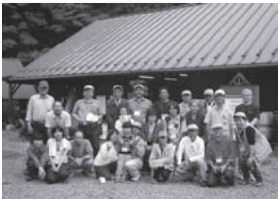
青川峡で指導者研修会

第9回公認オートキャンプ指導者全国研修会。交流会が6月12日(土)13日(日)に青川峡キャンプ場で行なわれた。