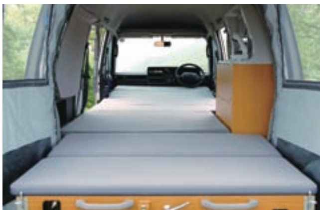
運転席までリビングになり、軽自動車とは思えない広いスペースが確保できる。