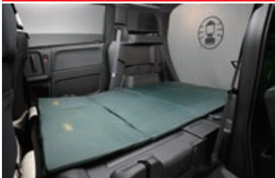
ホンダとコールマンで共同開発したキャラバンカー「キャンピングステーションColeman×Honda」の室内。外観はコールマンのグリーンを基調としている。

ラゲッジスペースの反転ボードで簡単にラックとなすスペースを作り出すことができ、壁面には小物が置けるビルトインシェルフも設定される。 小型床は、日常の足として、また荷物の積みおろしもしやすくキャンプなどにも最適。 159万8000円より 0120-112010。