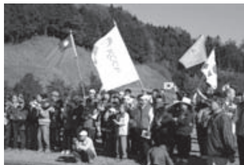
台湾 11月14日15日 第13回アジア・パシフィック大会

第13回アジア・パシフィック大会が、本年11月14日(土)・15日(日)に台北県三峽鎮の皇居鎮森林において開催される。