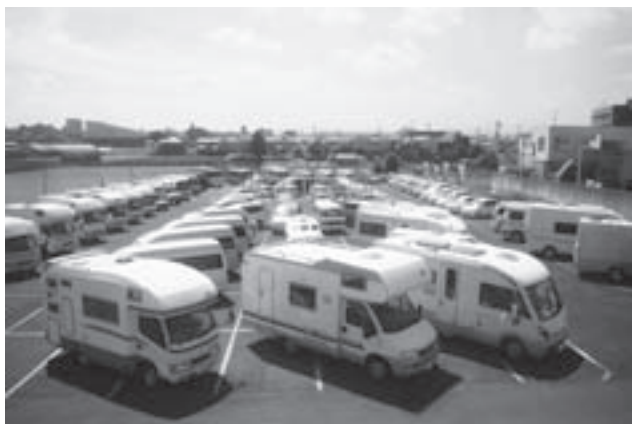
フジカーズジャパン