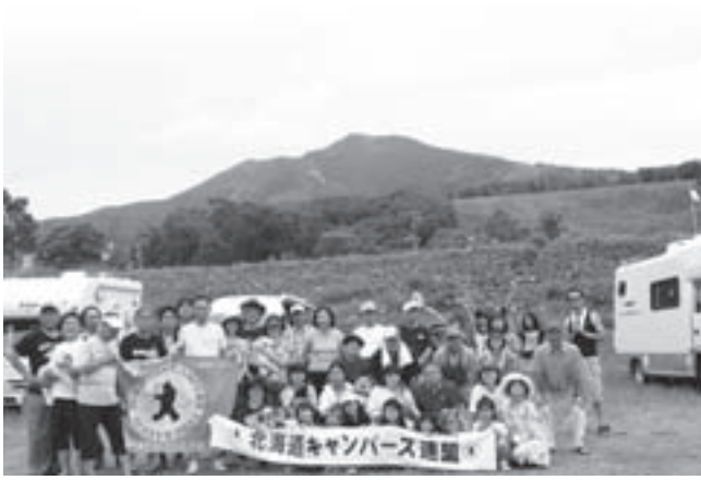
6月の北海道は異例の暑さ見舞われた。「会場が高原で良かった」と参加者の弁。

北海道のメンバーを中心としたキャンピングクラブ「北海道キャンピング連盟」が毎年開催している北海道オートキャンプ大会が、6月26日・27日、今年は一ツツの特設会場で開催され、約50人、20組が参加し新緑のまぶしいニセコ高原でのキャンプを楽しんだ。