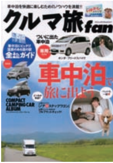
「クルマ旅ファン」 八重洲出版

クルマの紹介では、取り上げた全種類のラゲッジスペースやシートアレンジを紹介しており、キャンプ用のクルマ選びにも大変役立つ内容となっている。その他、小型キャンピングカーの特集では、詳細な情報を収録。国内唯一のキャンピングカー専門誌「オートキャンプ」発行元でもあり、情報の精度は折り紙付き。1260円。03・3552・8431。