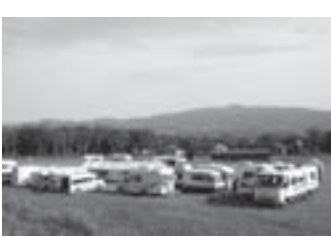
ちょっと大きめ?のキャンピングカーが並び会場

山頂付近にあるキャンプ場の特長を生かしたもので、三日月、金星、土星の輪なども見ることが出来る。地元の「アストロクラブふくやま」の協力で、主催はキャンプ場運営団体ホラーン。