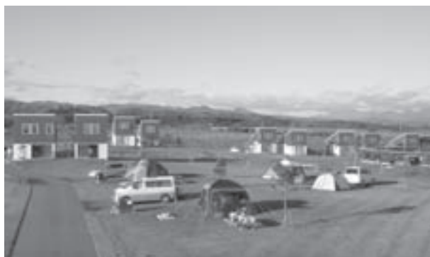
9月オートリゾート八雲で第40回全日本オートキャンプ大会

今秋9月18日〜20日に北海道八雲町の「噴火湾パノラマパーク・オートリゾート八雲」で第40回八雲町ほか地域の特色や