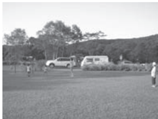
阿寒町ニニシベツ 11-37 0154-56-3020

にあり、白樺の林に囲まれた芝生のサイトは、1サイト毎に、落ち着いたプライベート感のあるレイアウトになっている。