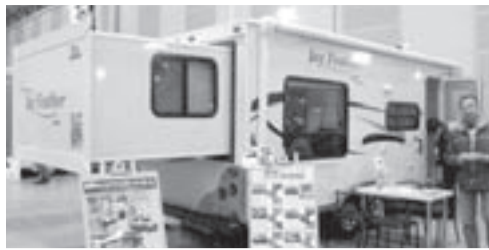
後部が伸びて広々室内 「ジェイフェザー」ボナンザ

風の抵抗が少ないウェッジ型ボディにコンパクトなボディで、けん引走行をよる軽快にし、牽引車負担を減らすなど、移動キッチンは積み込む準備を減らしてくれる。