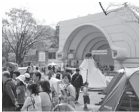
メーカーの人と直接話ができるのも魅力

キャンプシーズンの幕開けを告げるイベント、「アウトドア2010」が4月10日(土)・11日(日)、東京都代々木公園イベント広場で開催される。 2010年の最新キャンプグッズを一つの会場で一同に見ることができ、貴重な機会。 展示の他、ステージで