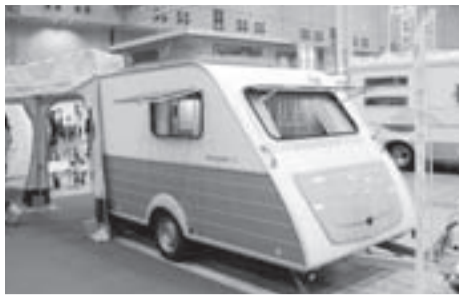
「キップコンパクト」 トーザイアテオ

屋根がリフトアップするほか、後部出入口部にキッチンが移動できるドイツ・ホビート社製キャンピングトレーラー。キッチンがテラスで使えるように取り外しができ、エントランス横に固定できる(写真下)。