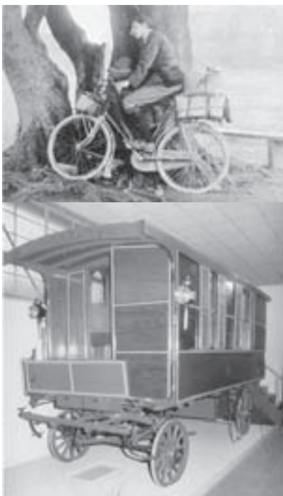
1905年当時のキャンパーと1884年製のホースキャラバン

観光の語源は、中国の「易経」に出てくる「観国之光」、すなわち「国之光を觀る」である。つまり他の国の価値ある文物を視察するという意味である。日本では一般に明治時代から使用された観光という言葉には、諸国をまわって見聞を広め