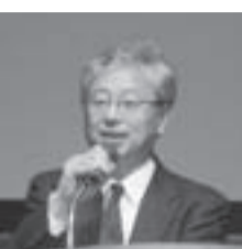
テレビ東京の経済番組「ヤスター」でもお馴染みの伊藤元重氏