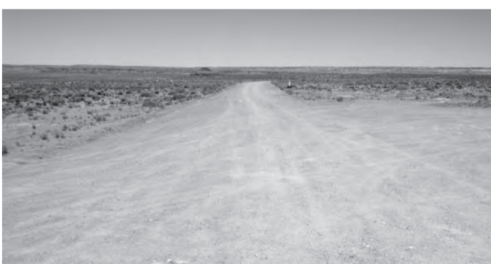
青空と褐色の大地の境目を区切る地平線

「昼食をどうしよう」というのである。ダイネットからランドキヤニオンを眺めながらの昼食。こういう贅沢な時間を堪能できるというのも、モーターホームの旅ならではの。こんな絶景を抱えた「カフェ」なんて、地上のどこを探しても見つからない。昼食後、いよいよモニュメントバレーを目指す。走ることも目もくらみにして、ようやくモーターホームのマイル表示の感覚にも慣れた。それにつれて到着時間も読めるようになってきた。「あと60マイル」などという表示が出てくれば、およそ1時間。「あと100マイル」などという表示は約2時間。