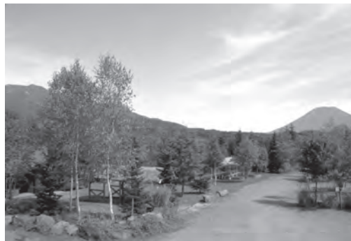
ニセコ・サヒナキャンプ場 北海道蘭越町

北海道の個人経営のキャンプ場の中でも高い人気を誇るキャンプ場。ニセコという有名な観光地にあり、立地に恵まれていることに加え、オーナーのキャンプに対するポリシーがあるように、キャンプ場の「サヒナ」という名前は、北海道に多いアイヌ語に由来する地名のようだがそうではない。同キャンプ場の冒頭にその名の由来が次のようにある。