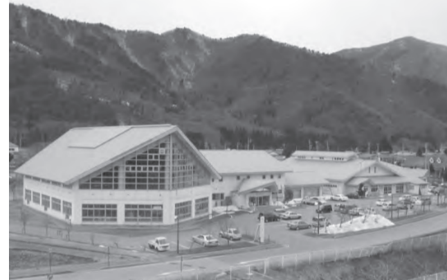
かつて鄙びた温泉に代わり現代の湯治場「立ち寄り湯」は巨大なものも多い。長野県の青木湖キャンプ場に近い「ゆーぶる木崎湖」

有害な環境から隔離する効果や、新しい気候に反応することによる治癒促進が得られるなどの効果があるという。