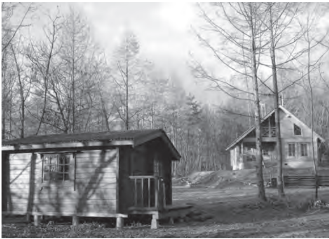
指導者が造ったキャンプ場 (長野県) あさまの森オートキャンプ場 (長野県)

する機会がなかったものもすべて自分で作っていかねばならない経験は、毎日新鮮だった。こうしたすべて自分でやらなければいけない「田舎暮らし」についての感想を聞くと「経済的には厳しい面もありますが、暮らしは前よりずっと豊かになりました」と話す。四季折々変わる景色に囲まれながら、山でとれたばかりの新鮮な食材を食べる生活は都会では経験できなかった豊かな生活だという。