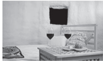
インスタントハウス室内