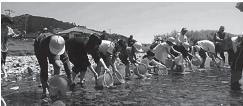
子供たちに郷土の川に興味を持ってもらうため鮎の稚魚の放流活動を行っている

ウォータース・リバイタルプロジェクトという活動をご存知だろうか。同活動は魚類や植物、地質など各方面の専門家による検証をもとに川を保全し、その地域振興の大切なコンテンツに育て、民間企業の参入や観光客誘致による地域の交流人口の拡大を目的に行われているという。