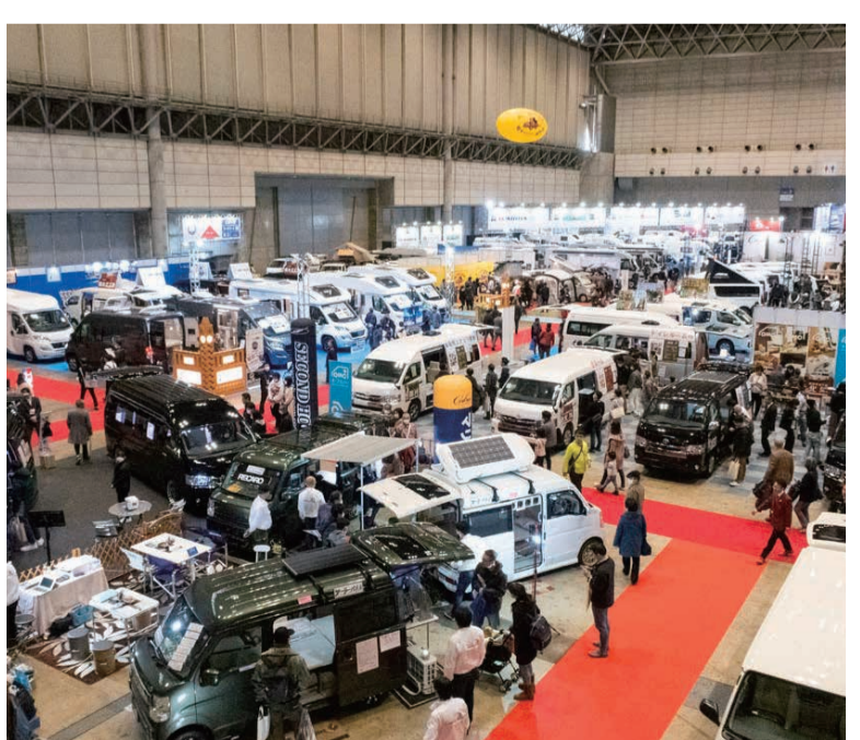
千葉県幕張メッセにて昨年より会場も広くなり開催

国内最大級のキャンピングカーの祭典、ジャパニーズキャンピングカーショー2020が今年も開幕。1月31日〜2月2日の3日間にわたって行われ、のべ6万6000人が来場した。今年は田中ケン氏や芸人ヒロシといった豪華ゲストが壇上上がり、笑いや発見あふれるユニークなトークがステージで繰り広げられた。また、グランエースの改造車やビームスとのコラボしたトレーラーなどトレンドをつかんだ車両も多く展示。キャンピングカー選びの新たな選択肢として注目されそう。