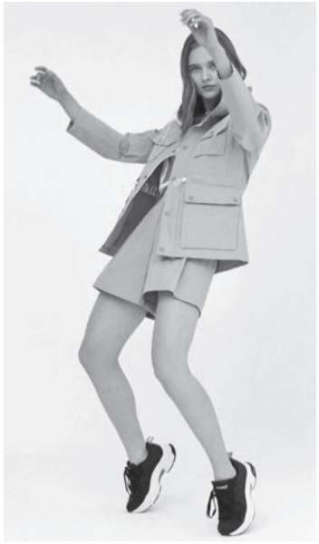
廃棄された漁網をリサイクルしたナイロン素材とオーガニックコットンを混紡して使用した、エコアルフのレディスウェア。同ブランドではレディース、メンズ、キッズ、シューズ、アクセサリー、ヨガのジャンルアイテムを手掛けています。

意図せず釣り上げたプラスチックゴミを回収し、分別・再生して繊維に変え、衣服として販売するのです。その後、エコアルフの海洋プラスチックの回収はタイにも活動を広げたほか、日本でも今後、回収・分別・再生による製品化を目指すとのこと。環境に対する考え方は人それぞれで、すべての人が同じように問題意識を持つことは難しいかもしれません。しかし、好むと好まざるにかかわらず、いまがそうした時代であることは理解しておく必要があります。すでにアウトドアメーカーでも素材が適正なルートで調達されたものか？ また、素材の製造過程で環境に悪影響を及ぼす化学薬品を使用していないか？ などに配慮している企業がいくつもあります。今後、サステナブルについては消費者と企業、どちらの意識が先に成熟するのでしょうか。これからの見守りたいと思います。