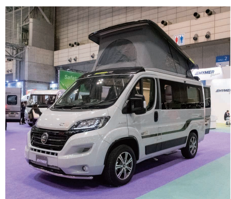
ハイマールの2020年モデル「シドニー」は、フィアット・デュカトをベース車両に大人二人が就寝可能なポップアップルーフを搭載。