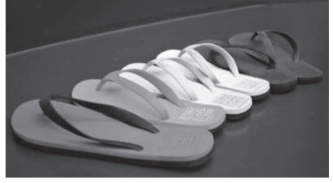
廃棄タイヤをアップサイクルしたエコアルフのビーチサンダル。アップサイクルとはゴミをリサイクルして、より付加価値の高い製品に生まれ変わらせることを意味します。エコアルフの公式HPのアドレスは https://ecoalf.jp/

ビューティフルキャンピング (ペンネーム&活動名) ファッション誌、ファッション広告を中心に編集・執筆を行う。2011年春から、キャンプ空間をスタイリッシュに演出する楽しみ方「ビューティフルキャンピング」を広めようと活動中。 http://beautifulcamping.net/ https://www.facebook.com/BeautifulCamping