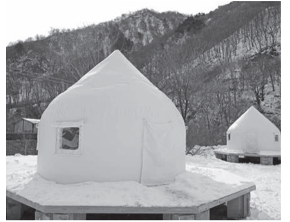
大自然の中でたのしみ野外ロウリュサウナ インスタントハウスは一般のテントに比べ頑丈で断熱性に優れ2名から宿泊できる