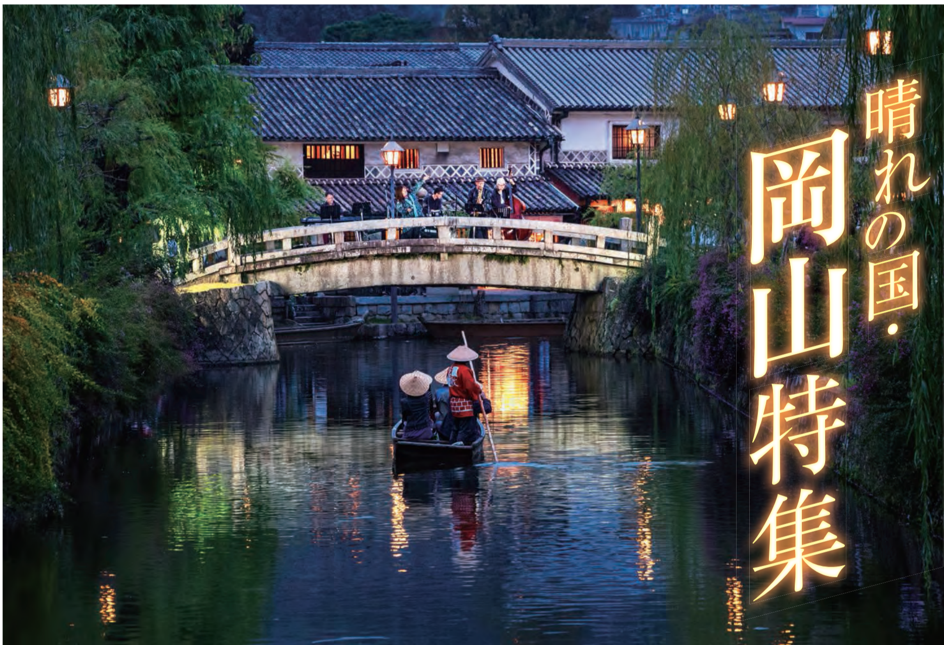
▲倉敷ジャズストリート：二日間のフィナーレを飾る中橋セッション

「町家スタイルで楽しむJazz」をコンセプトに09年12月にスタートした「倉敷ジャズストリート」は、スタッフから出演バンドまですべてがボランティアで構成され、地域の人々の協力のもと、倉敷を訪れる人々と参加ミュージシャンの皆が一体となって楽しむイベント。倉敷美観地区内のお寺やアトリエ、街角など、あちらこちらの会場で様々な演奏が行われ、街中にJAZZがあふれる2日間となっている。カフェの一角の小さなスペースから、ビッグバンドの倉敷芸文館まで会場の大きさも様々。中でも、フィナーレの「中橋セッション」は、夕暮れの倉敷川にかかる橋の上で行われ、辺りの風景と相まって幻想的な雰囲気の中JAZZを堪能できる。プロアマ問わずだれでも応募できるので、我こそはと思う人は挑戦されてはどうだろうか。 演奏する人も聴く人も、観光に訪れた人も、すべての人が楽しめる倉敷の町。2020年は10月31日・11月1日開催予定。 HP https://www.jazz-street.com/