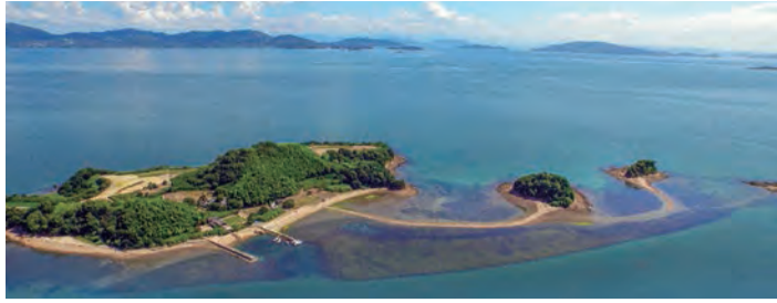
▲三島が砂の道で弓形に連なる

温暖な瀬戸内ならではの、明るい海を臨む風光明媚な牛窓は、日本のエーゲ海と呼ばれている。恋人の聖地と呼ばれる口