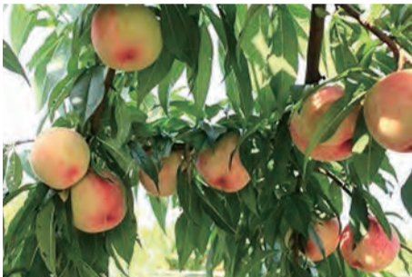
みずみずしい完熟の桃たち

新見市草間1204 TEL 0867-74-3202 HP http://www.kusamadai.com/k/fruit/fruit_01.htm