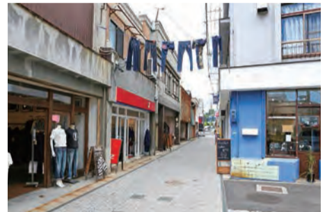
通りには個性豊かなジーンズショップがずらりと並ぶ

事務局：倉敷市児島味野2-5-3 問合せはHPより http://jeans-street.com/