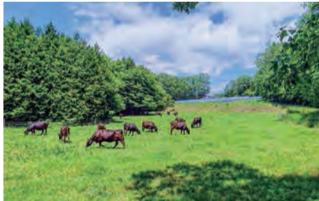
放牧地でのびのびと草を食む千屋牛

岡山県の北西に位置する新見市は、北は鳥取県、西は広島県に接しています。自然豊かな山に囲まれ、阿哲台と呼ばれる日本有数の石灰岩地帯があり、大小200近くの鍾乳洞が市の中に点在しています。中でも「井倉洞」は西日本では秋吉台に次ぐ全長1200mの規模を有する鍾乳洞で、市内の観光スポットのひとつとして人気です。またドラマや映画のロケ地にもなった「満奇洞」も並んで人気です。冬にはウインタースポーツも楽しめる場所もあり、自然を二年中満喫できる町です。