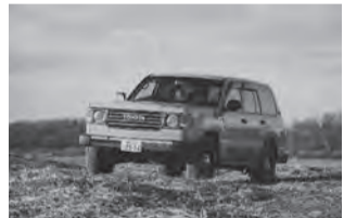
ランドクルーザーBAMBA

おり、慣れない旅先での困りごとにも対応してもらえるので安心して自由な旅を満喫できる。