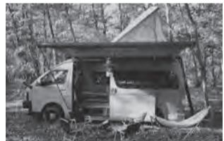
ハイエースCAはルーフ付き