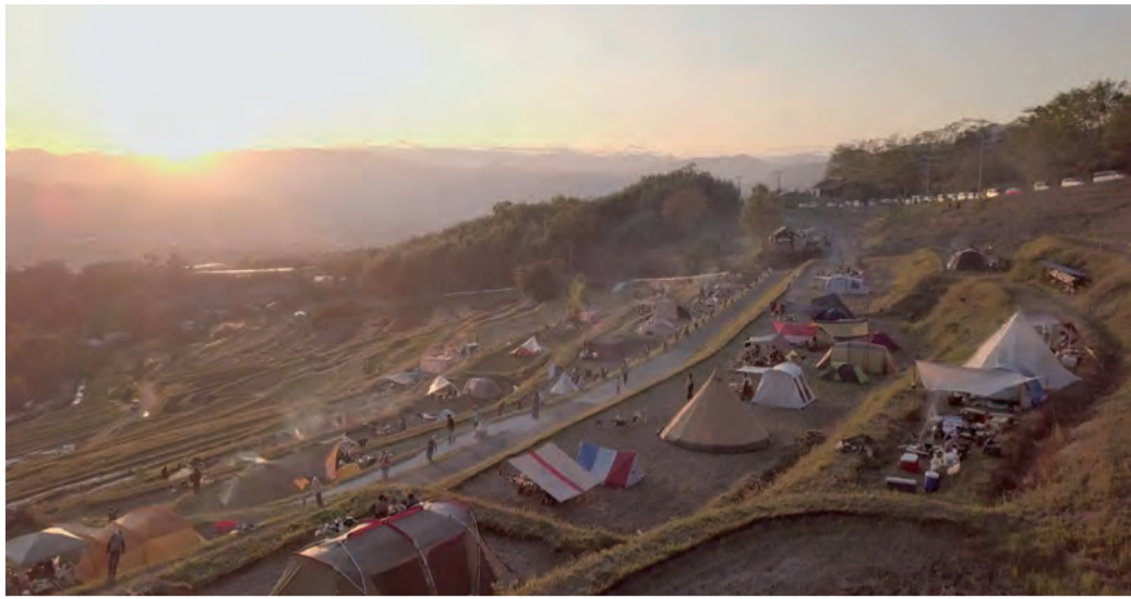
棚田でキャンプが出来て保全活動に繋がっている