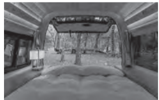
ハイエースLXの内装

「車中泊リゾートに」をテーマに、オリジナルキャンピングカーのレンタルとエリアガイドを組み合わせた、自分スタイルの旅を楽しめるサービス。レンタルできるキャンピングカーは、車内を快適なベッドルームにカスタムした、「ハイエースXL」と「ルーフレント付きで、最大4名までの就寝を可能にした、バンライフ仕様の「ハイエースCA」。料金は共にキャンピングアレンタル込みで24時間3万5000円。さらに冒険心をくすぐる「ランドクルーザーBANBA」は、100系をベースに60系を彷彿とさせる外観にカスタム。こちらはキャンピングアレンタル込みで24時間2万8000円で借りられる。どの貸出車両にもコンシェルジュサービスを提供。予約前に要望を伝えておけば、おすすめの絶景スポットや飲食店、温泉、アクティビティなど地元ならではの情報を得ることができる。車内にはコンシェルジュへ連絡が取れるタブレット端末が備え付けられて