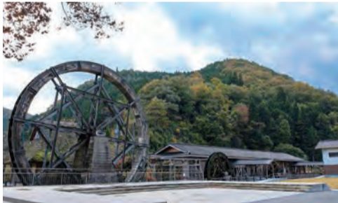
リニューアルオープンの準備が進んでいる夢すき公園

谷蔓牛の継承と若手農業従事者の育成や、竹の頭数を増やし、千屋牛も順調に育てている。畜舎を活用して放牧を育てている。耕作放棄地・空舎を有効活用して放牧を育てている。畜舎を活用して放牧を育てている。