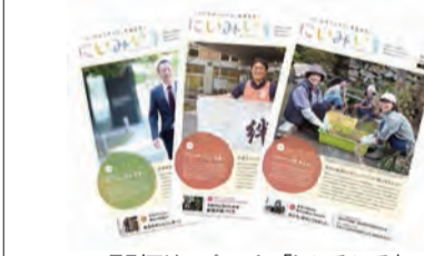
月刊フリーペーパー「いみいる」

し、桃狩りが長く楽しめるようになっている。他にも梨狩り、りんご狩りが体験でき、7月から12月まで楽しめる。入園料だけで食べ放題なのもうれしい。完熟ならではのおいしさは、目当ての品種の収穫時期をねらって訪れたい。