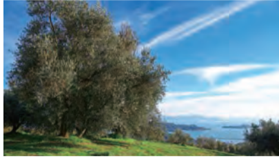
▲オリーブの緑と海の青が美しい