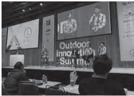
アウトドアイノベーションサミット2019が開催。全国から300を超えるアウトドアに関わる事業者、団体および官公庁関係者が集結。