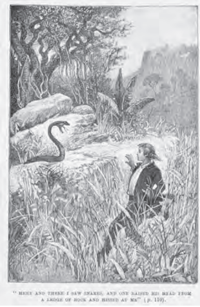
スティープンソンによって書かれた「宝島」も冒険小説としては非常に有名です。こちらは1897年発行版の挿絵。大英図書館所蔵。

多くの子どもはキャンプ場に来たら、普段は味わえない環境を楽しんでいるでしょうけれど、楽しめない子が増えているそう。キャンプ場にいるにもかかわらず、スマホや携帯ゲームに夢中で自宅と同じように過でしてしまつたというのが現代の問題点です。子どもにしてみれば、キャンプが好きでもないのに親に連れてこられたという感覚なのかもしれません。大人だって歩きスマホを止められない人が少なくないのですから、子どもがデジタル機器を手放せないのも無理はないと思います。そうした子どもに少しでもキャンプに関心を持ってもらうために、普段から自然にまつわる児童文学に触れる機会を設けてみてはいかがでしょうか。