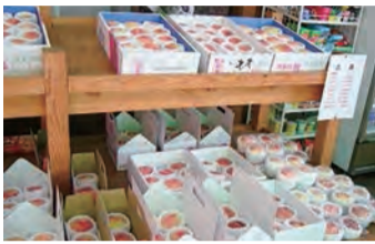
おみやげの桃も充実