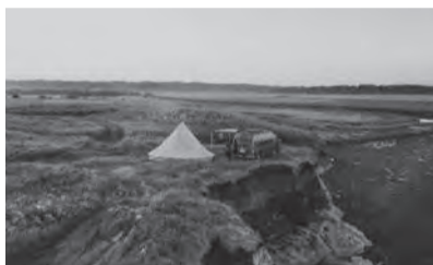
絶景地でキャンプを楽しむ

昨秋、北海道十勝エリアでスタートした新しいスタイルのオートキャンプ旅が注目を集めている。提案しているのは、