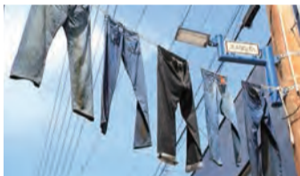
ビンテージジーンズが風になびく

300m南北1200mほどのエリアに、30店ほどの店が立ち並ぶ。09年に2店舗から始まった児島ジーンズストリートは、今や世界中のジーンストが訪れる、メイドインジャパンジーンズのメッカとなった。駅構内や行きかうタクシーまでデニム柄で彩られ、まさにデニムの町。数々の個性的な店の中からお気に入りの探