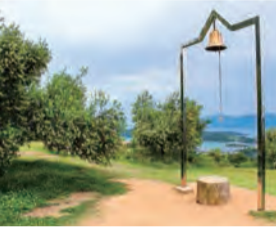
▲園内にある幸福の鐘