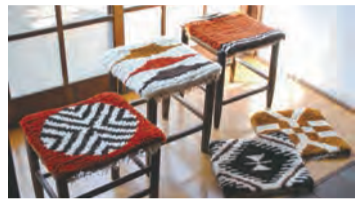
研究所の一角で開店するショップはGWのみ