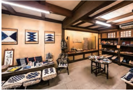
11月に開催される倉敷民芸館での作品展

付属工芸研究所として設立されて以来、日々の暮らしに根差した美しい織物を作る技術を伝え続けている。糸を染めるところから始まるすべて手作業の品は素晴らしい。全国から志して集った研究者たちは卒業後も制作を