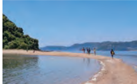
▲干潮時に現れる白砂の道