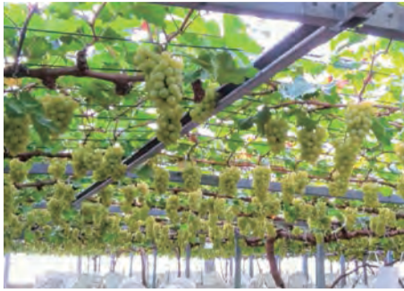
たわわに実るぶどう棚